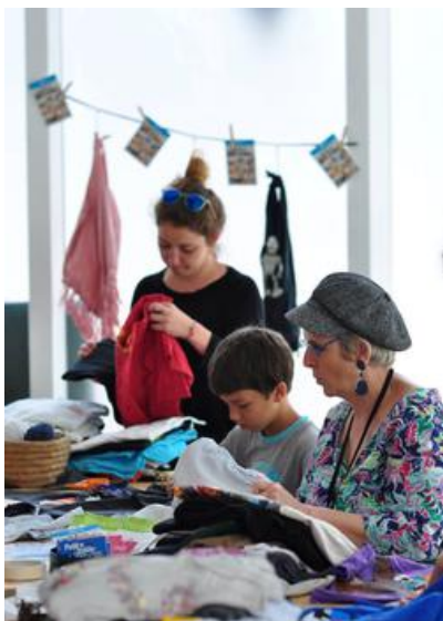
Au programme: ateliers collaboratifs.

Pas question de proposer un service type, chaque conciergerie devra répondre aux envies spécifiques des habitants du quartier (qu'ils habitent dans un immeuble Quartus ou non). C'est ainsi que le promoteur s'est associé à la start-up Madeinvote pour interroger les usagers du projet de son projet «La Minoterie» à Ivry-sur-Seine sur leurs désirs. Bilan: plutôt que des services de pressing ou de dépannage et autres billetteries, les sondés ont manifesté leur envie de balades urbaines pour découvrir le quartier, d'achats groupés et de retour aux circuits-courts (fruits et légumes, ...) ou encore d'événements festifs de voisinage. Et à Marseille pour le programme 2e Élément, Quartus s'est rapproché d'une locale, Domino Services, déjà bien implantée pour les services à la personne, afin de gérer sa future conciergerie.