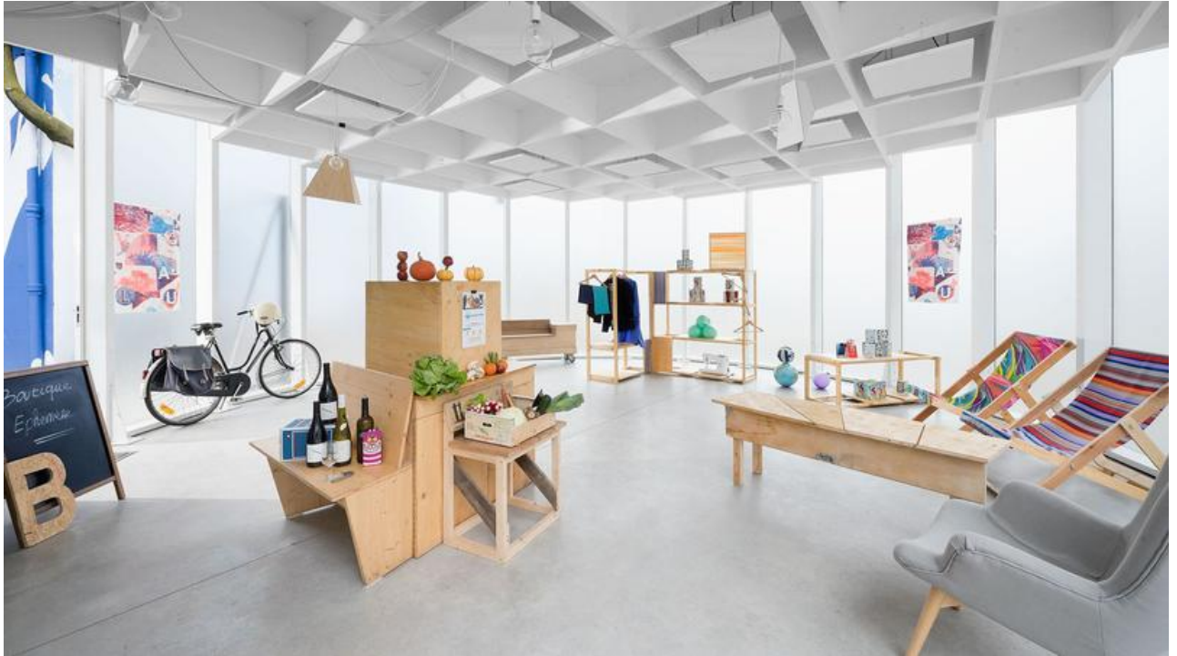
La conciergerie nantaise du programme ilink.

Par Jean-Bernard Litzler Mis à jour le 17/07/17 à 12:08 Publié le 17/07/17 à 06:00